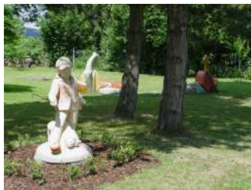
Ladova vila, dnes Památník Josefa Lady, a socha na její zahradě