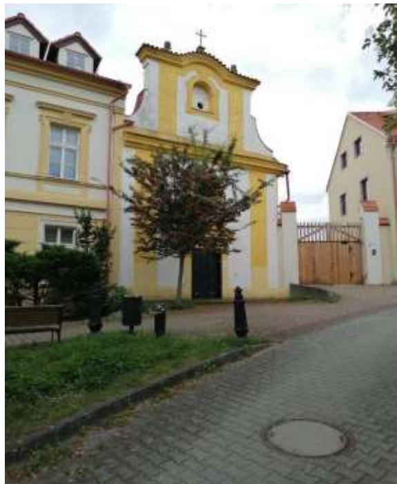
Opravované stáje, městský erb a nejstarší kosořský statek č. 15