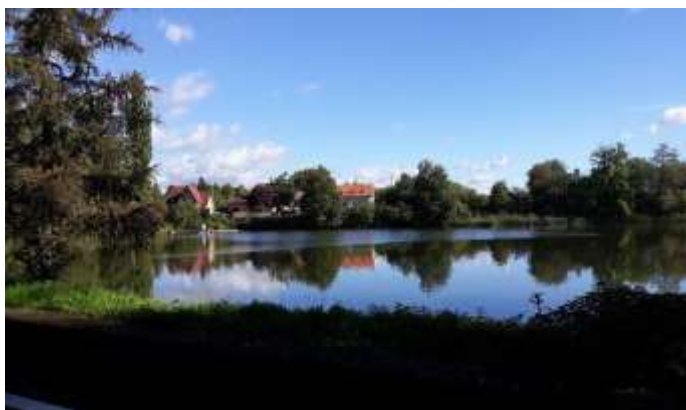
Těsně pod rybníkem se setkává Líbeznický potok s tím Mratínským a jako Mratínský již putuje do nedalekého Labe.