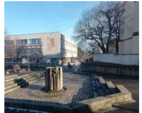
Pískovcovou plastiku před školou vytvořil v roce 1983 sochař Milan Mácha.